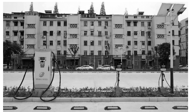
首批“一小区一策”充电桩投用

5月1日,首批参照“一小区一策”方案建设的充电设施,在钟楼区五个老旧小区附近正式投用。