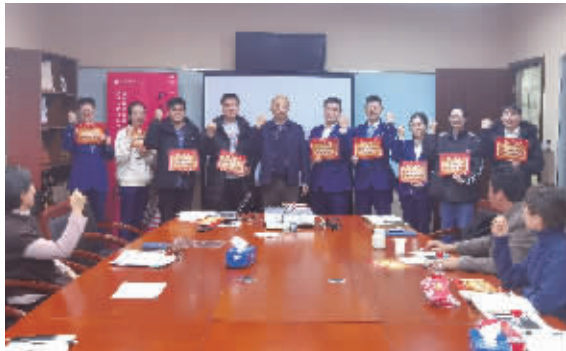
交通银行新区支行打造年轻战斗团队

2022年,是党的二十大召开之年,也是中国共青团成立100周年。无锡交行青年文明号集体以迎接和学习宣传贯彻党的二十大精神为主线,结合庆祝建团100周年,团结引领广大青年员工在实现中华民族伟大复兴中国梦和推动无锡交行高质量发展的进程中凝心聚力、奋发向前、建功立业,以实际行动迎接党的二十大胜利召开。