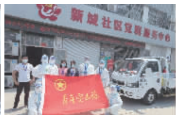
无锡交行青年员工参与防疫志愿活动

的大米,由于物美价廉,深受宜兴周边老百姓的青睐,一度是超市里的抢手商品。疫情期间,由于下游市场需求量激增,在库的稻谷短缺紧张,公司只能通过交易市场公开竞拍来获得稻谷储备。但在当前疫情形势下,公司手头的竞拍资金并不宽裕,预计无法获得充足的稻谷储备。交通银行宜兴和桥支行在走访中了解了企业的竞拍需求和资金缺口,立即高度重视、迅速反应,通过多渠道充分沟通,为企业量身定制了500万元流动资金贷款的授信方案。在方案商定过程中,支行考虑到企业融资用途的特殊性,结合当前纾困政策,为企业在融资利率上做了让利,并开辟绿色通道,加班加点完成业务申报审批,仅5个工作日完成业务全流程,有效缓解了企业的燃眉之急,获得了客户的点赞好评。目前,该企业在资金获得补给的情况下,已成功竞拍到了大批稻谷储备,能够有效满足疫情期间的日常运营需求,为市民“米袋子”稳定增