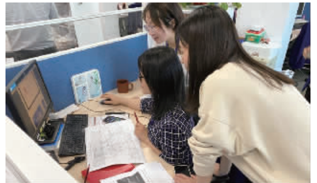
无锡交行数字化转型团队开展工作

CIPS金融利器。CIPS标准收发器作为银企间跨境人民币业务场景量身定做的业务处理与信息交互工具,是党中央关于金融市场双向开放和人民币国际化的一项重要战略部署,在满足用户人民币全球支付业务需求,助力人民币国际化方面发挥重要作用。推进上线这项金融利器,无锡交行数字化转型团队深知责任重大、使命在肩。接到任务后,团队第一时间组建专班,成员加班加点、紧密配合,在短短两周内就完成了注册申请、安装调试、联通专线、账户配置、投产测试等工作,创下了CIPS项目落地的“最快速度”,成为无锡地区首单、长三角区域第二单、全国第四单完成CIPS“企业版”全流程落地的分行。在积累了成功经验的基础上,团队总结优势、再接再厉,再次抢先落地了地区首单“间参版”CIPS项目,成为地区唯一一家成功落地CIPS“双首单”的金融机构,在同业中彰显了交行