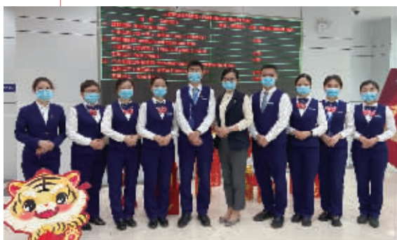
交通银行新区支行营业室青春洋溢,专业过硬的“小青椒”们