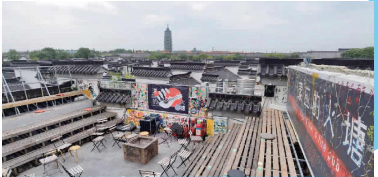
民宿楼顶的露天酒吧