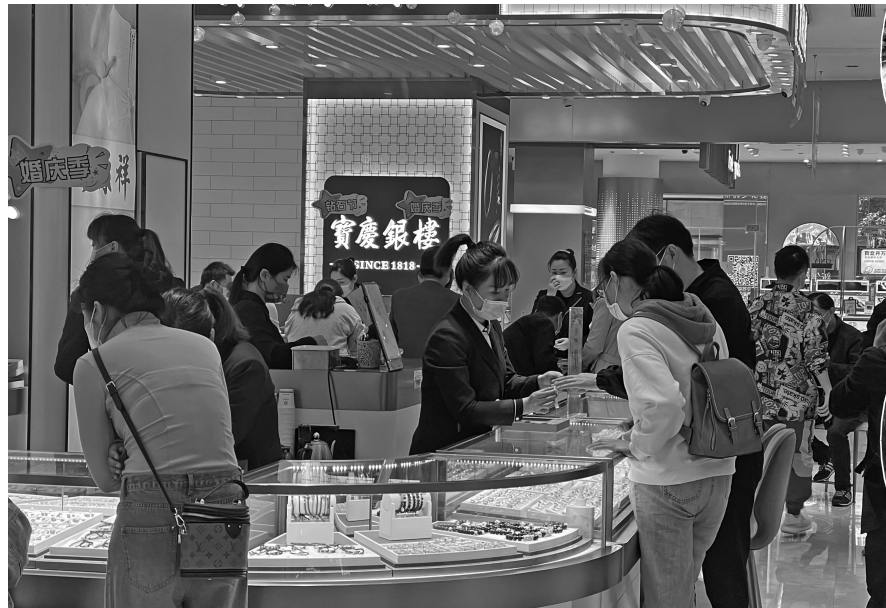
商场金饰柜台人气火爆