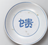
大地馈赠 拒绝浪费