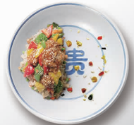
俭以养德 杜绝浪费

五一假期期间,南京市委市政府鼓励平台、商户匹配各类消费券,开展打折让利优惠,更好地满足市民留宁过节消费需求。目前,首批复市复业补贴也已直达全市16个街道1157家商户,发放补贴金额401万,第二批补贴正在组织申报。