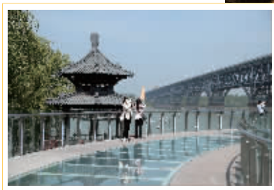
▲游客打卡拍照 ▶“亲水圆环景观桥”夜景灯光璀璨