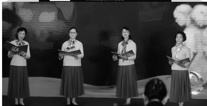
活动现场

活动当天，主办方还介绍了全省第一家街道级全民阅读促进会—西善桥街道全民阅读促进会的筹备情况。