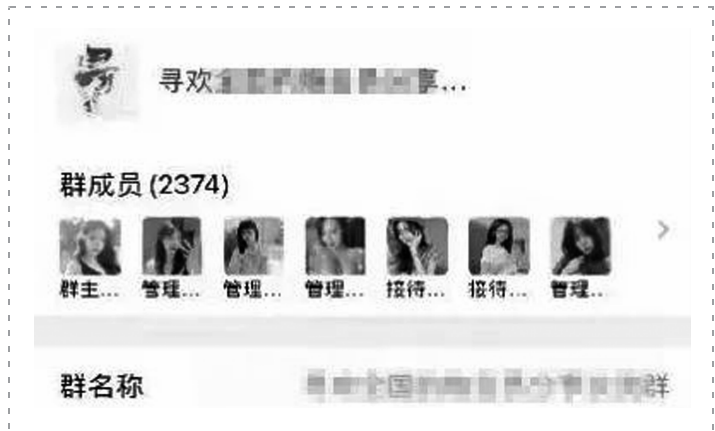
某款App聊天群充满诱惑,管理员等头像都是美女

近期,盐城男子小张突然收到一条好友申请,同意后,对方发来链接,称下载链接内的App可提供“全国约会”。色迷心窍的小张下载了一款名为“桃奢生活”的软件,并添加对方客服为好友。随后,客服将小张拉进了一个“全国约会的会员分享交流群”,并发来几张美女照片,让小张确定心仪的人选。等选定了其中一个美女后,客服却告知必须完成“3单任务”才能约会。