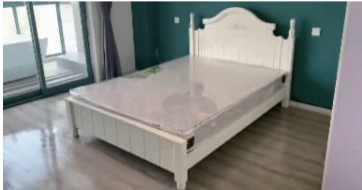
房屋打扫前后对比