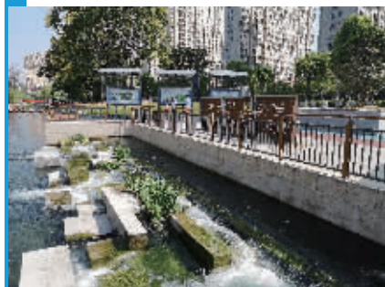
北十里长沟东支河长制主题公园