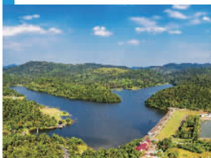
溧水区无想寺水库省级水利风景区