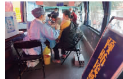
流动疫苗接种车送“苗”上门

快报讯(记者 李娜 通讯员 周敏 方文杰)4月20日,在建邺区云锦路社区,一辆新款流动疫苗接种车吸引了居民的注意。这是南京公用中北运通公司对接建邺区防疫指挥部,联合云锦路社区专门设立的,流动车为辖区居民、老人及行动不便人员提供送“苗”上门服务,实现“应接尽接”,为居民健康保驾护航。