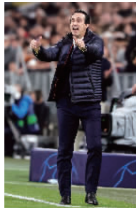
埃梅里指挥比赛