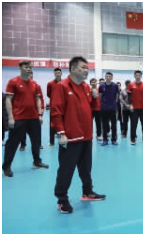
中国女排主教练蔡斌此前在宁波北仑带队集训 据中国女排官微

但到了淘汰赛阶段,面对美国、塞尔维亚、土耳其、意大利等一众劲旅时,才是真正考验这支中国女排的时刻。对于这项赛事,蔡斌同样进行过表态,表示将全力以赴,力争打出好成绩。