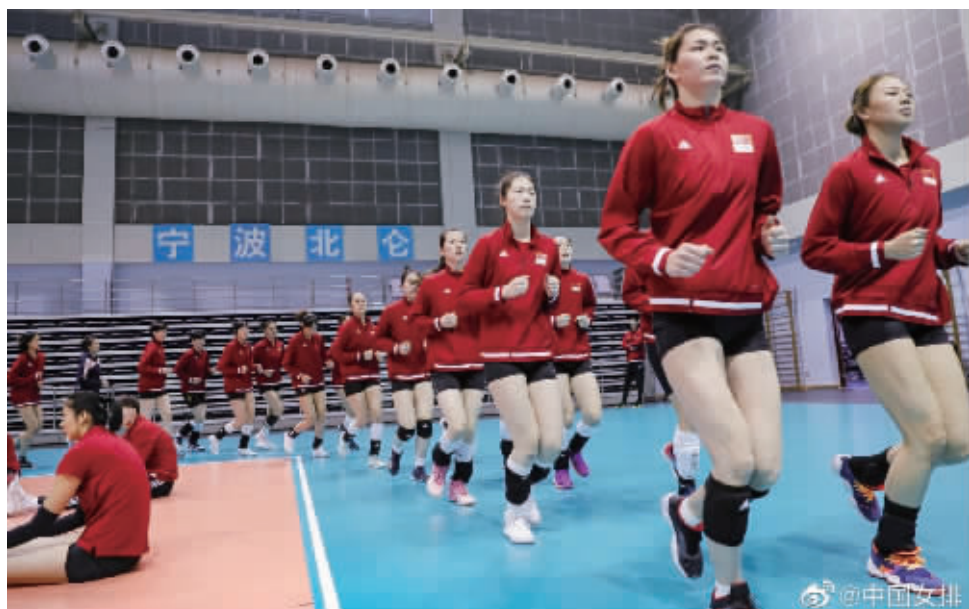
中国女排此前在宁波北仑进行集训 据中国女排官微