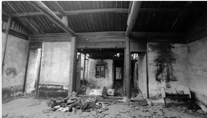
晚香堂现状

1月10日，滨湖区检察院收到群众举报称，因城市发展规划，古建筑晚香堂即将面临被拆除的危险。对此，该院高度重视，次日就抵达现场取证，通过查阅资料、无人机航拍、走访调查等方式固定证据。