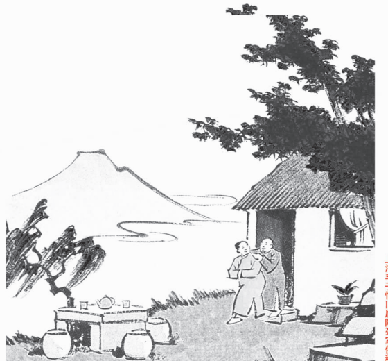
上海于伟旧居陈列室供稿