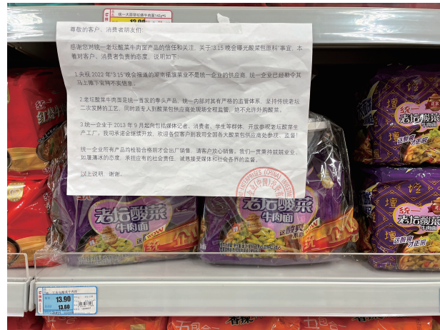
统一老坛酸菜方便面带文件销售

快报讯(记者 潘荣)4月13日，“康师傅老坛酸菜方便面重返超市货架”登上热搜，引起不少网友关注与讨论。据报道，在云南部分商超内，与老坛酸菜方便面一起放在货架上的，还有一些公告函、文件。南京商超销售情况如何？现代快报记者当天探访南京多家商超了解到，大部分商超仍未上架康师傅老坛酸菜方便面，已上架超市的货架上也附有说明文件。在康师傅的官方旗舰店，也有老坛酸菜方便面在销售，店铺首页也附上了“产品符合国家相关标准”的文件说明。