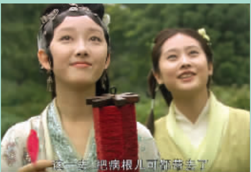
黛玉“放晦气”(2010版电视剧《红楼梦》)