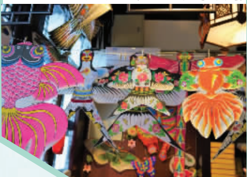
多款风筝