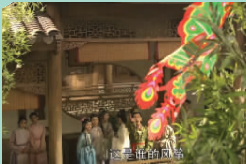
七十回众人看风筝(2010版电视剧《红楼梦》)

生在南京，家中三代人都曾任江宁织造的曹雪芹，按现在的说法，也是“新南京人”。作为一个无忧无虑、爱玩爱闹的小少爷，南京风筝大概也给他留下了很深的印象。