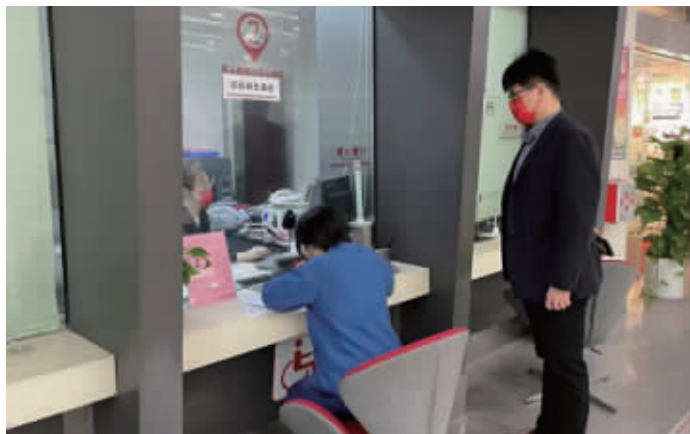
无锡工行新吴支行开通绿色通道为客户办理业务

在了解情况后，该行立即行动，在市行支行的联动协作下，紧急开辟“绿色通道”，协调各部门帮助客户解决问题。一方面联系押运公司协商延迟库箱接收时间，另一方面，工作人员安抚客户情绪，详细解释停业情况，与此同时，柜面员工迅速做好取款前的准备工作。一切准备工作就绪，工作人员