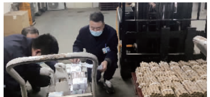
建行无锡分行开启绿色通道，工作人员清点出55.6万元小面额人民币

“真是太感谢了！如果说我们在保障市民的‘菜篮子’，那么建行则为我们的稳定运营注入了金融活水。”无锡天惠超市的财务人员边说边从建行无锡新通扬支行工作人员手中接过兑换好的55.6万元小面额人民币。