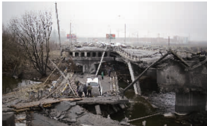
当地时间2022年4月2日,乌克兰基辅郊外,民众从伊尔平镇撤离,图为当地一座被毁坏的大桥