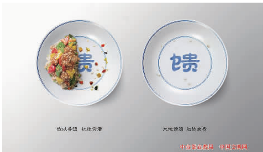
荤以素清 社健旁章