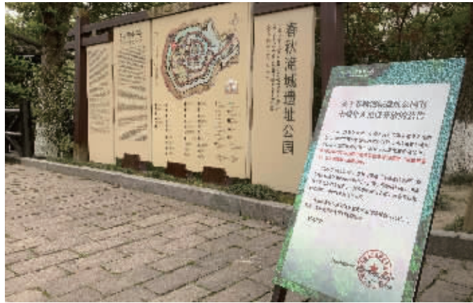
整改后,淹城遗址公园在景区入口放置“对未成年人免票”的公告牌

据介绍,对于检察机关发出的诉前建议,淹城遗址公园非常配合,承诺会尽快落实整改,完善票