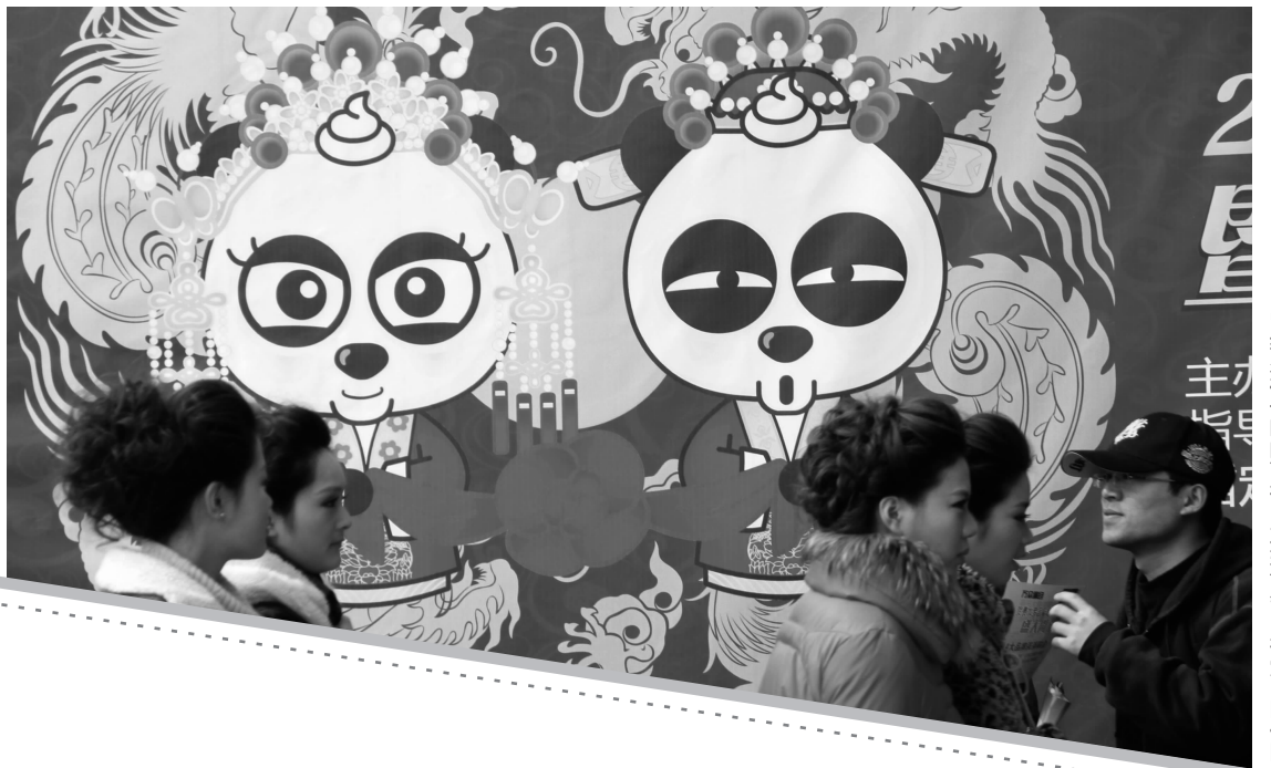
曾经盛极一时的西祠网友婚博会