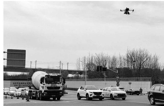
警用无人机在严管路口上空盘旋

快报讯(通讯员 宁交轩 记者 王瑞)为营造安全、畅通的道路交通环境,压降路口交通事故,从2月22日起南京交管部门在南京主城区设立24处右转弯停车观察严管路口,中型及以上货车在右转前须停车观察。该举措实施一个月以来,交管部门通过电子抓拍、警用无人机协助管理、加大现场违法整治力度等手段,进一步提升中型及以上货车驾驶人“右转必停,观察再行”安全意识,“护右”电警一个月抓拍右转不停车违法70起。3月20日,现代快报记者获悉,从3月14日起高德地图为南京地区正式上线右转弯停车观察导航提醒,成为全国首个开通“右转必停”导航提醒的城市。