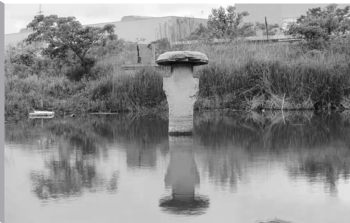
石刻曾长期浸泡水中