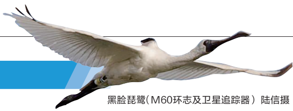
黑脸琵鹭(M60环志及卫星追踪器)