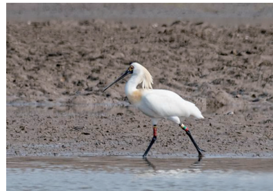
黑脸琵鹭(H97)

快报讯(通讯员 周玉香 薛浩男 记者 花宇)近日,南通环境监测中心生态观测工作人员在如东、通州湾沿海滩涂湿地多处发现国家一级重点保护野生动物黑脸琵鹭,共计25只。其中,自带“身份证”环志共3只。南通沿海湿地是鸟类迁徙途中中的重要“补给站”。