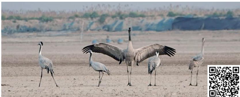
蓑羽鹤(左二),其余为灰鹤 扫码看视频

快报讯(通讯员 高志东 赵永强 记者 王菲)近日,江苏盐城湿地珍禽国家级自然保护区监测人员,在射阳沿海滩涂首次记录到蓑羽鹤。至此,盐城沿海成为全球为数不多能同一时期观察到7种鹤的地区之一。