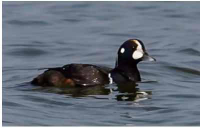
丑鸭在盐城黄海湿地觅食

快报讯(记者 王菲 通讯员 江俊波)近日,盐城黄海湿地大丰滩涂上来了了一只可爱的褐色鸟儿,它的眼前和耳后都有一个白色的小斑点,腹部有褐黄相间的漂亮花纹。经专家鉴定,这是一只罕见的丑鸭,它的到来,填补了江苏省鸟类的空白,此前江苏省没有丑鸭分布的记录。