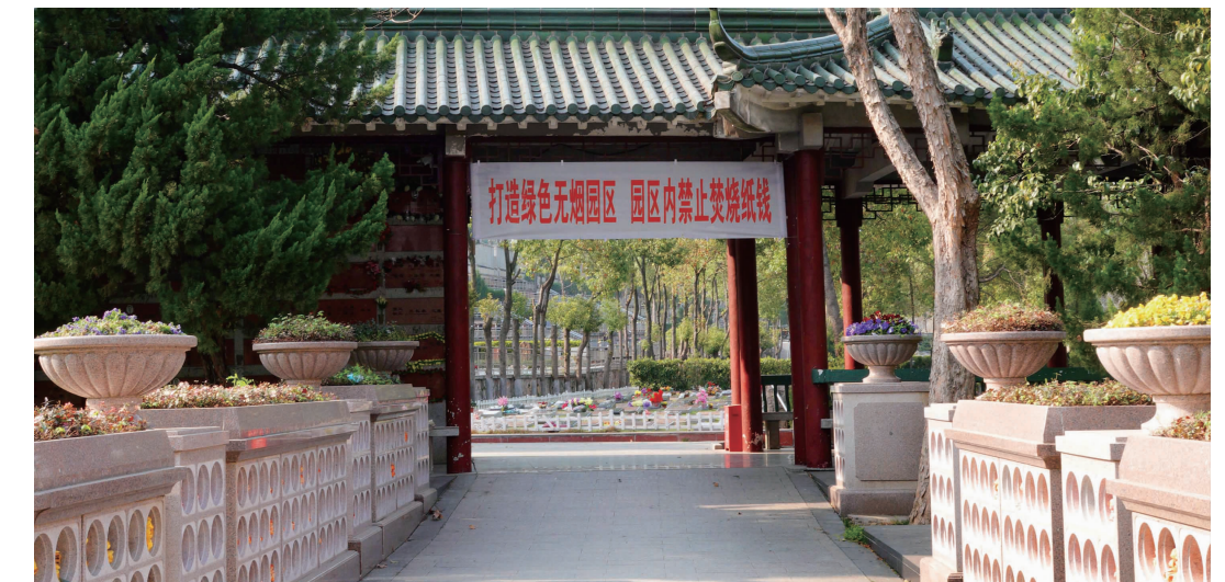
雨花功德园

雨花功德园工作人员介绍，现如今越来越多的市民选择节地生态安葬方式，绿色殡葬逐渐深入人心。刚刚过去的双休日，在南京一所重点高校退休的王教授也在雨花功德园订购了小型生态墓。“政府一直在鼓励市民选择少占地或不占地的生