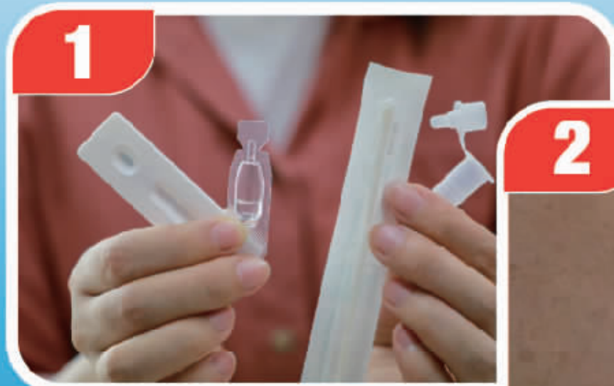
将提取液全部倒入样本提取管中