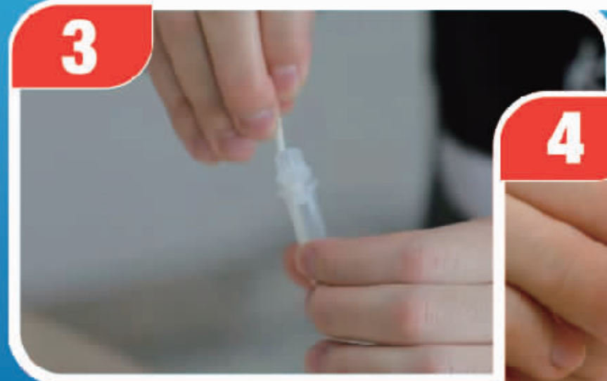
采好样本的拭子插入样本提取管,旋转10次