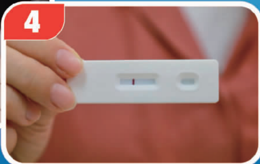
将样本提取管垂直地向检测卡的样本孔加入3滴拭子提取液。静等15分钟,如检测卡C、T区域均出现红线,结果为“阳性”,如C区域出现一条红线,结果为“阴性”