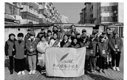
小记者与小红妈爱心社成员合影

金坛区传承红色基因，组建小红妈志愿宣讲队，开辟“小红妈爱心社”党史学习教育红色专线，实施“红心向党 星火相传”——“小红妈理论巴士”进基层活动。小红妈爱心社通过“车厢展示传理论、公交接送学理论、城乡专线送理论、童言童语讲理论”四种形式，累计开展“长荡湖上红书舫”“圩圩道来”志愿宣讲服务100余场次，各类公益爱心活动1000余场次。