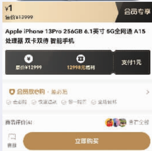
“萌推”页面显示1元买iPhone13 Pro 手机截图