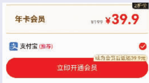
一次年卡会员充值要39.9元 手机截图