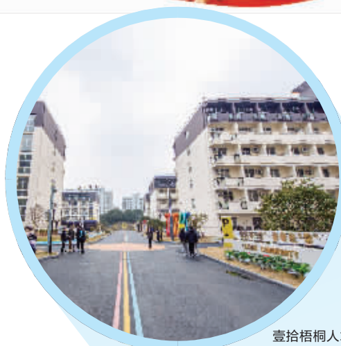
壹拾梧桐人才社区