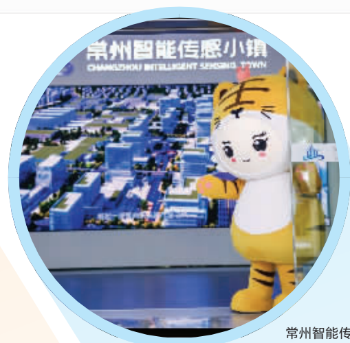
常州智能传感小镇