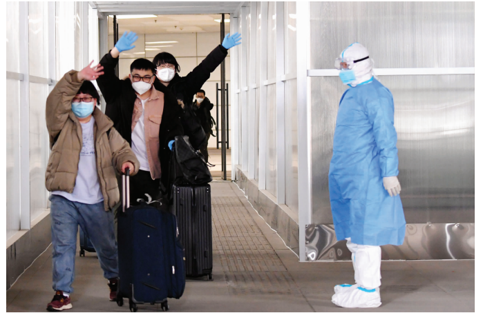
3月5日，中国公民乘坐临时航班抵达郑州新郑国际机场