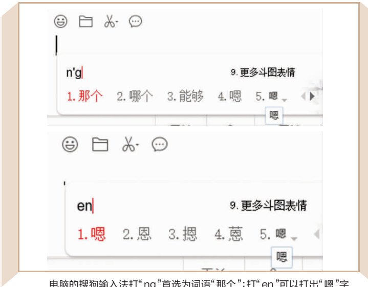
电脑的搜狗输入法打“ng”首选为词语“那个”;打“en”可以打出“嗯”字

“嗯嗯好的。”“嗯?这是什么情况?”“嗯,确实……”在日常生活、聊天中,“嗯”这个字或许是我们最常使用的一个语气词了。在网上,“嗯”更是许多人的口头语。在输入“嗯”的时候,你是用什么拼音打出来的?最近,有家长发现,自己打了20年的“en”,女儿的老师教的却是“ng”。现代快报记者发现,有这样困惑的成年人还不少。是教材修改了,还是从来就是这样? 现代快报+记者 徐梦云 王益文/摄