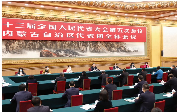
3月5日,习近平参加内蒙古代表团审议