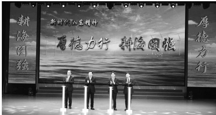
发布会现场

现代快报记者了解到，2010年，如东就已经提出“厚德笃行，扶海越江”的如东精神，有力激发全县上下跨江融合、争先进位的壮志豪情。