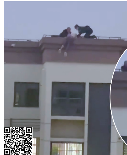
▲女孩悬在楼顶 ▼女孩被拉回来 视频截图