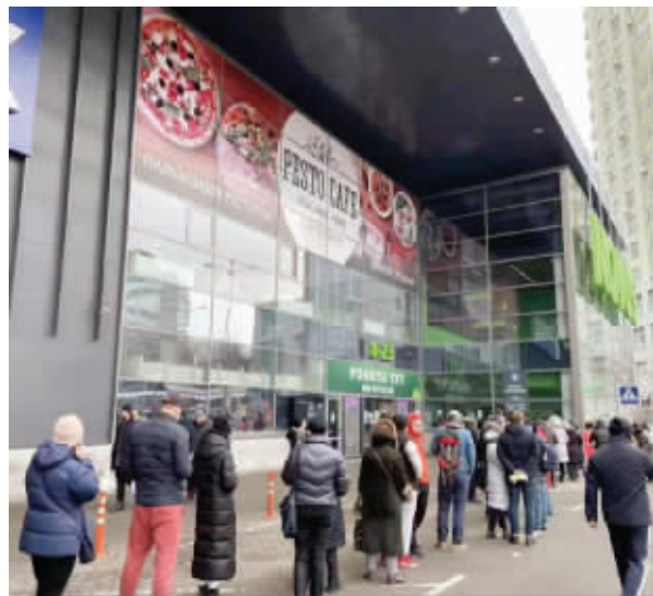
银行门前排起长龙,市民都在取现金

2月24日,乌克兰总统表示乌克兰全境进入战时状态。响彻乌克兰上空的警报声让当地人认清了战争已经开始的现实,他们纷纷带着行李箱前往地铁站,希望可以撤离到安全区域,超市、银行……也都排起了长龙。