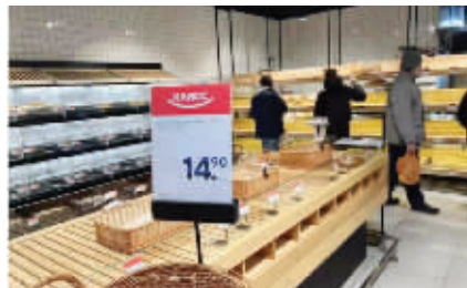
超市里的面包被抢购一空