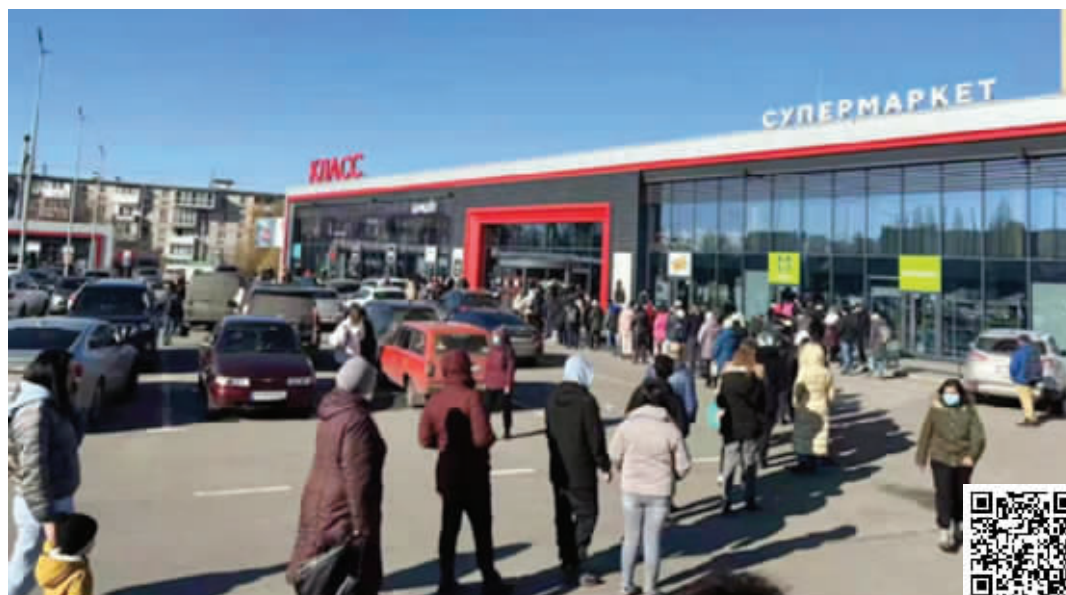
乌克兰哈尔科夫的超市外排起长龙,人们准备采购生活物资 扫码看视频