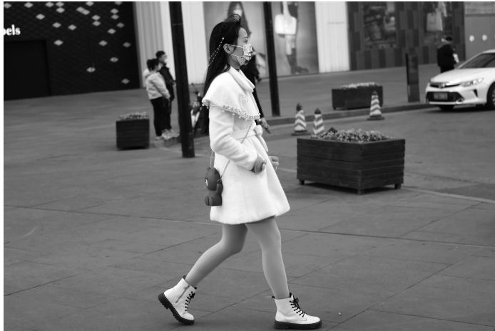
早晚温差大,提醒大家出行注意保暖

最高气温在13℃到16℃。但最低气温仍然在冰点上下,南京最低气温-1℃到-2℃,26日到27日最低气温1℃到3℃。