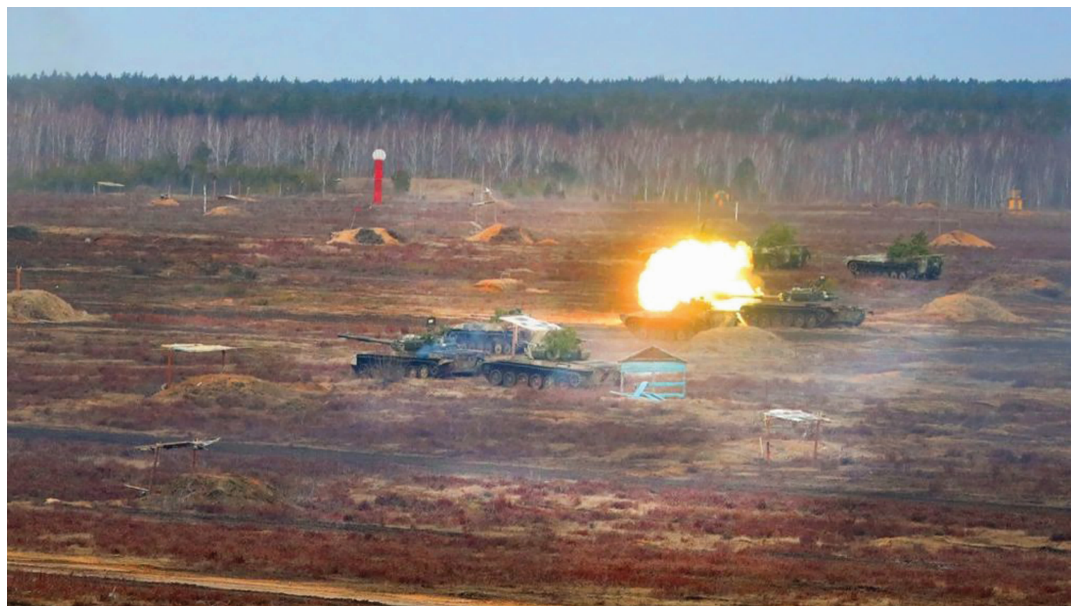
2月19日,俄罗斯与白俄罗斯的“联盟决心-2022”联合军演最后阶段实战演习在白俄罗斯奥布兹-列斯诺夫斯基靶场进行