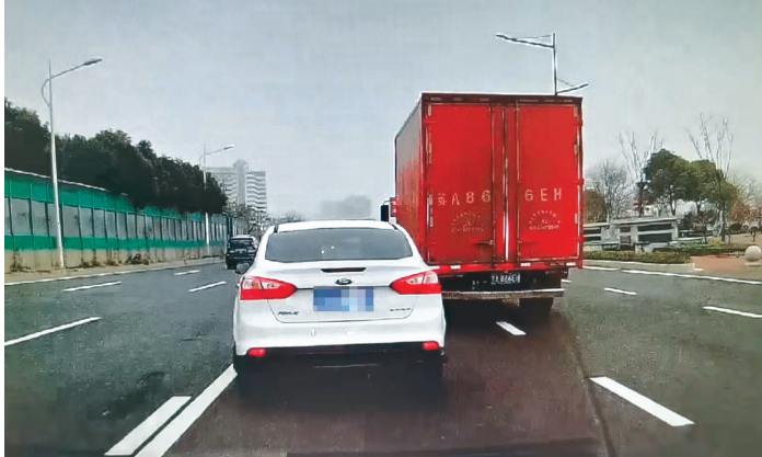
违反禁止标线的举报现场图片