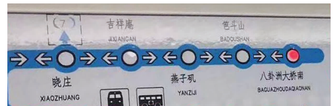
地铁1号线新列车增加了新站点提示

快报讯(记者 刘伟娟)最近,网传图片显示,南京地铁1号线列车上,1号线北延线的5个站点并入线路图。1号线北延线是不是快要通车了?2月23日,现代快报记者获悉,1号线北延线部分区段已进入铺轨施工阶段,3座车站进入安装装修施工阶段。