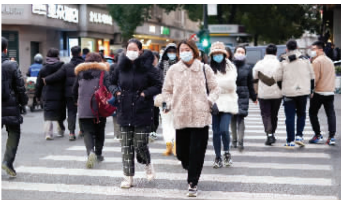
昨天天气晴朗,但早晚温差大,大家出行注意保暖

以南京来看,周二白天,全市多云到阴,夜里南部地区阴有小雨或小雨夹雪,到了周三上午,南京南部的降水就将停歇。镇江、常州、无锡、苏州南部等地也是如此,预计周三