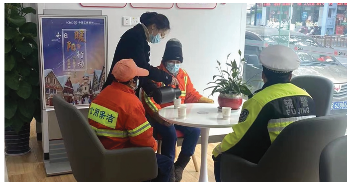
驿站站长为户外工作者们倒茶

为丰富少年儿童的金融知识,各支行纷纷组织活动。惠山支行联合当地幼儿园,请小朋友走进银行