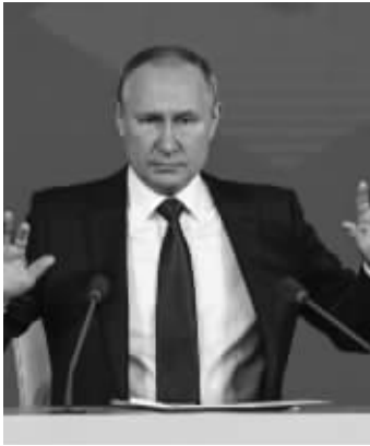
俄罗斯总统普京