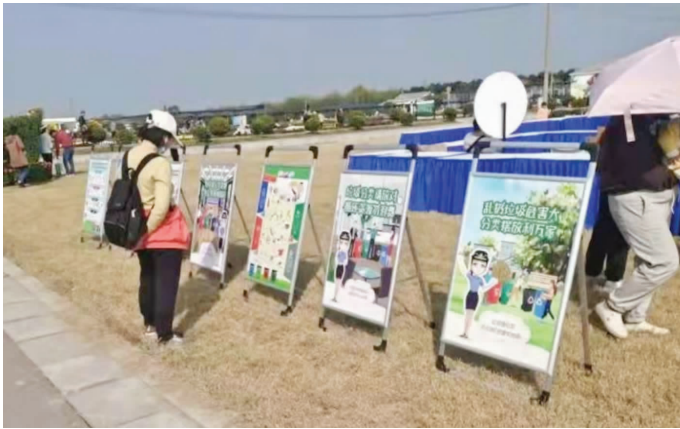
江宁区文旅行业进行垃圾分类宣传 资料图片