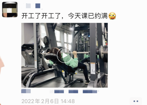
开工了开工了,今天课已约满