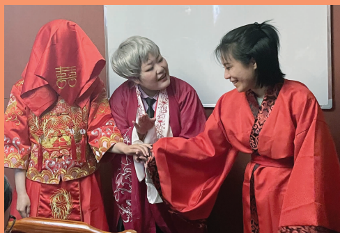
“剧本杀”成为年轻人过年的“新宠”