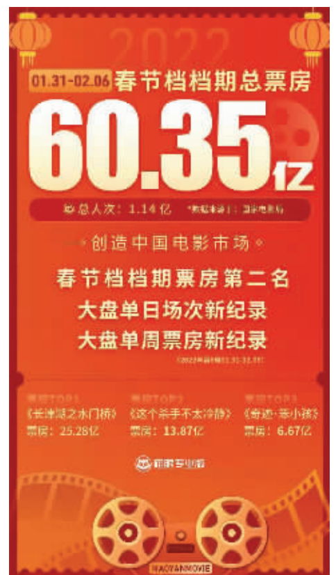
图片截自猫眼专业版