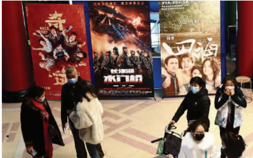
春节档江苏观众贡献票房全国最多