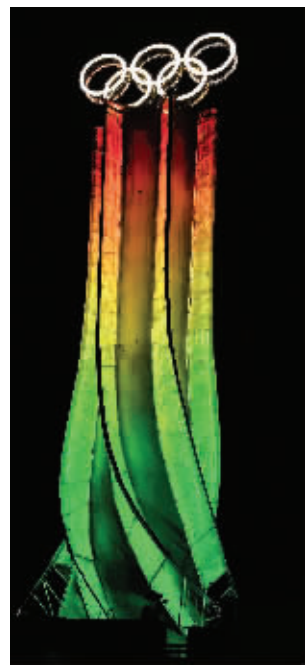
夜幕降临,海陀塔成为一道亮丽的风景