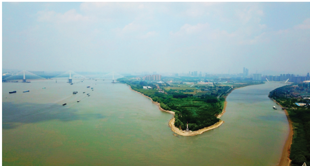
长江沿岸