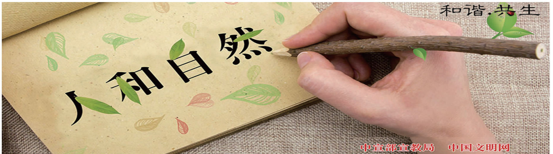
中宣部宣教局 中国文明网

值得一提的是,高铁虽然是个庞然大物,但是它“洗澡”非常节约用水。高铁的“洗澡水”都是循环水。在机洗处,我见到了集水坑、回用水池、膜渗透水池、除钙水池等。原来高铁的“洗澡水”会通过沉淀、过滤、深化等步骤,进行二次利用,用不了的会排到污水站。