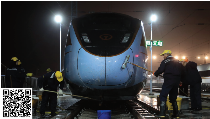
工作人员正在清洗动车组列车