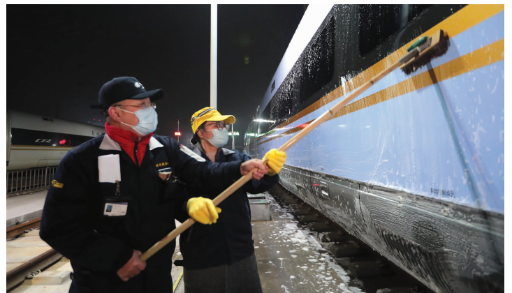
现代快报记者和工作人员一起清洗动车组列车