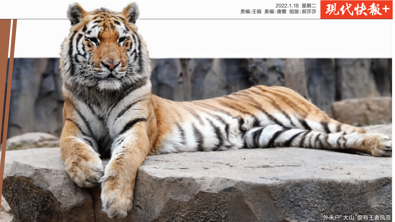
外来户“大山”很有王者风范

他说:咖啡是男孩子,块头大胆子小;图图和奇妙是两姐妹,奇妙胆子也小,但图图很有探索精神