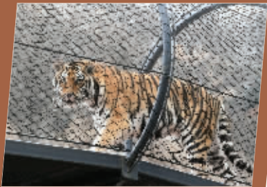
“图图”威风凛凛地走过空中通道