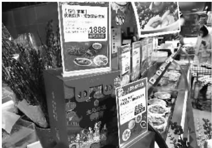
可带回家的预制年菜产品