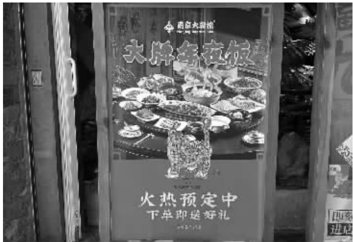
堂食年夜饭接受预定

距离春节还有不到半个月的时间,年夜饭准备得怎么样了?1月16日,现代快报记者走访南京多家餐饮机构后了解到,多家餐饮店年夜饭堂食座位已被预订一空。在堂食年夜饭火爆的同时,预制菜也悄然走俏。记者注意到,连肯德基等洋快餐品牌也瞄准了“年夜饭”市场,推出了自己的预制菜产品。