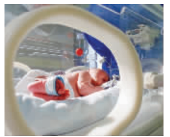
“早产儿音乐疗法”能帮患儿缓解哭闹烦躁

亲子之间的一道桥梁。这不仅纾解早产儿住院期间因父母无法见面引起的焦虑情绪,也缓解父母自身的压力,对于缓解宝妈产后抑郁焦虑的效果也十分明显。