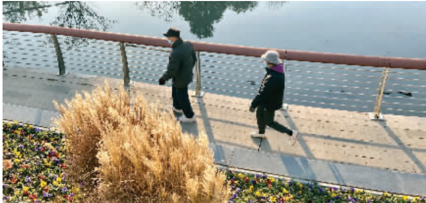
昨天天气晴朗,气温依旧较低,市民穿着厚棉衣在公园散步

云,最低温仍在冰点下,省内东南部地区0℃左右,东北部地区-4℃左右,其他地区-3~-2℃,全省大部分地区有冰冻;最高温回升明显,沿淮和淮北地区8~9℃,其他地区10℃左右。晾晒和出门游玩都是不错的选择。