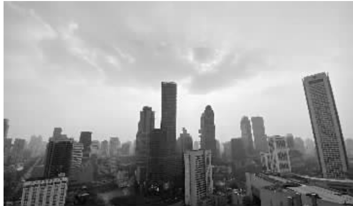
昨天,冷空气吹走雾霾,能见度明显好转