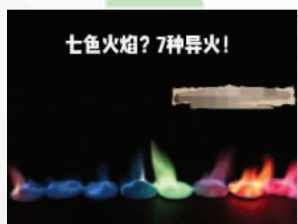
“七彩火焰”实验 网页截图