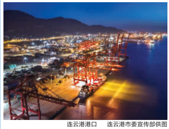
连云港港口