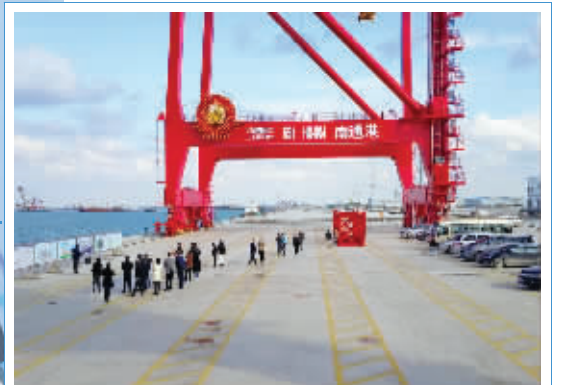
通州湾新出海口吕四起步港区