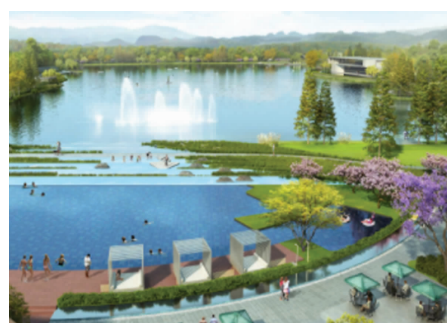
大浦塘城市公园效果图

大浦塘城市公园项目也位于栖霞区,以现状大浦塘水域及沿线绿地为建设基础。设计范围北至汇仙路,东至汇通路,南侧毗邻在建主题酒店,西侧边界为现状沿山道路,项目总体占地约为39.68公顷,其中:先期启动区